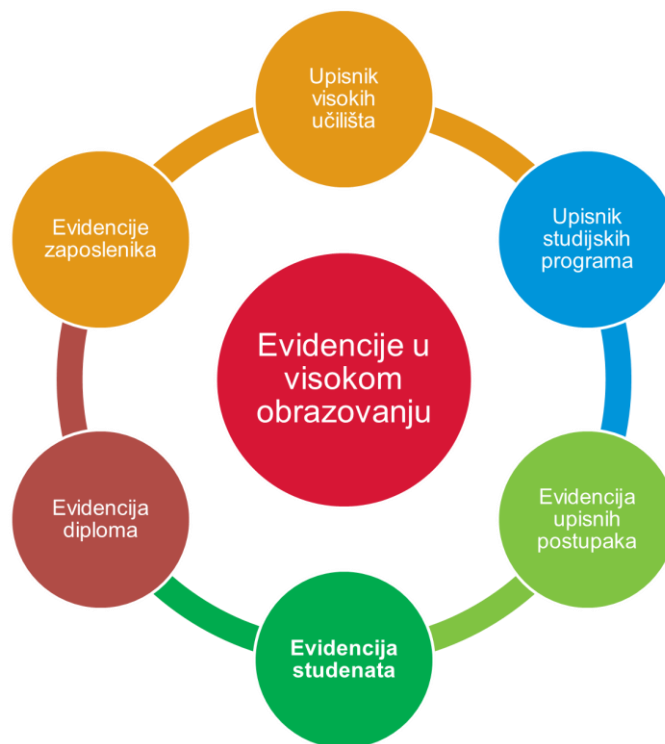
Evidencije u visokom obrazovanju

E-pošta: e-sveucilista@srce.hr; isevo@srce.hr